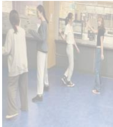
图 1 八年级学生为大型舞蹈比赛练习动作!!

2024 学年于本周开幕，体育 8 年级的学生进行了舞蹈比赛。 以下是其中一个团队的表演，学生通过新开发的体育课程 PE 8-12 Curriculum 体验到丰富的主动学习机会，该课程由 Byng PE 部门开发和提供。