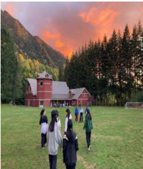
图6 在充实的一天活动之后，学生前往当天的最后活动——篝火合唱会，同伴辅导员为他们提供了一个娱乐之夜，然后学生返回小屋休息过夜