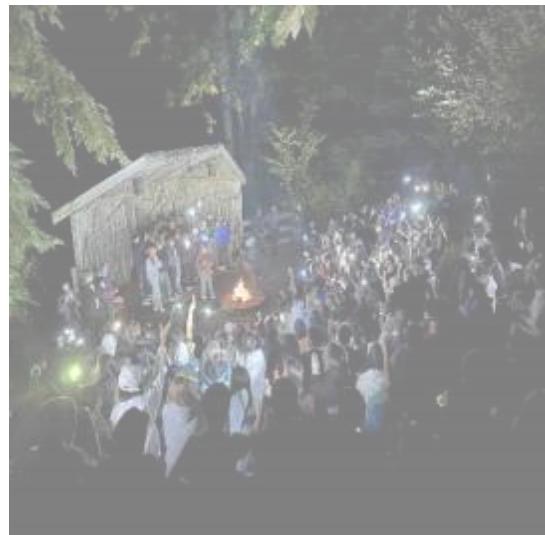
图 7 同伴辅导员主持了当天的最后一个活动，进行了露营的合唱活动

特别感谢所有参加露营并提供如此出色支持的员工，他们为我们的八年级学生创造了如此积极、强大、欢迎的学习环境！