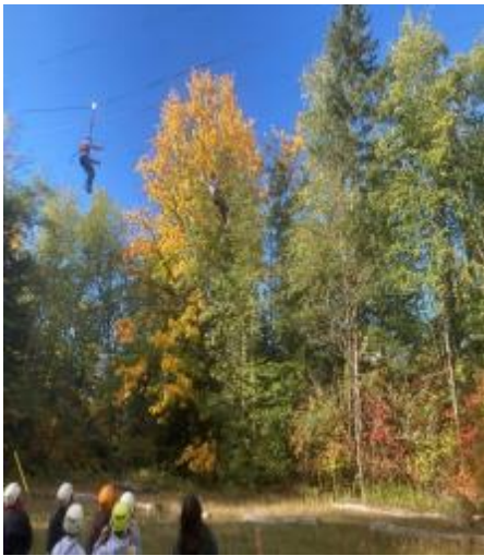
图3 学生们在滑索上空中飞翔，轮流飞越树梢。