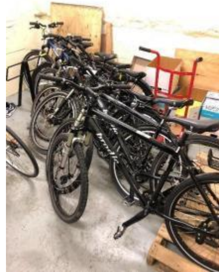
图 12 以前使用过的 VPD 自行车被捐赠给学校的自行车俱乐部。