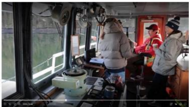
图 3 学生纪录片组采访 LAXKW'ALAAMS 的精神号船长

通过原住民教学和学习实现和解： 家长、员工和 VSB 社区成员参与 Musqueam 欢迎图和解项目。