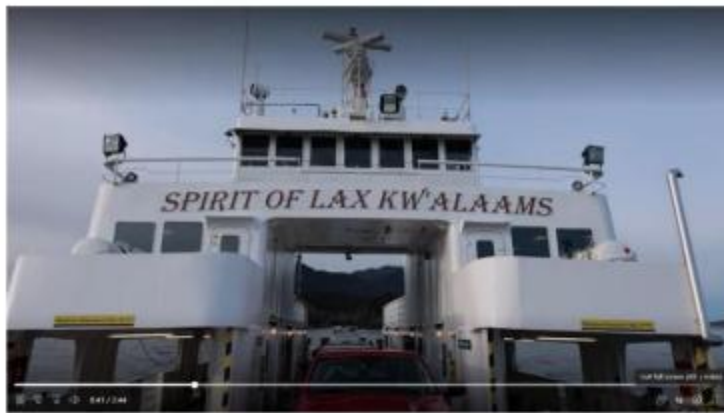
图 2 在 LAXKW'ALAAMS 的精神号船上进行穿行