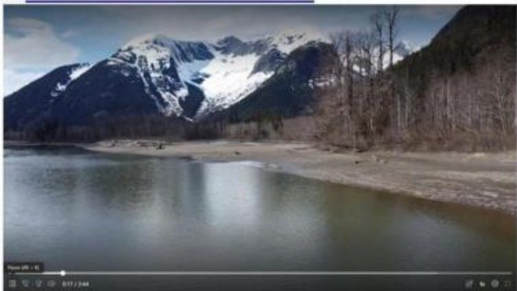
图 1 美丽的斯基纳河只是 ByngVideo 纪录片团队北上之旅的目的地之一。