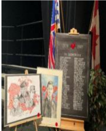
图二周五，学生和教职员聚集在一起举行集会，纪念那些在20世纪和21世纪的重大冲突中献出了自己的生命的加拿大男女军人。