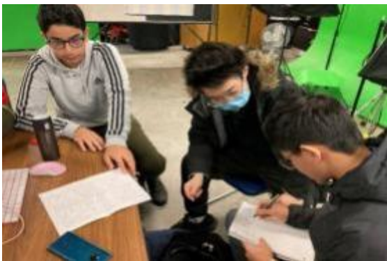
图6 A 一群电影制作人合作编写剧本短剧并完成故事板