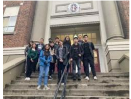
图11 地球爱好者俱乐部开会讨论未来一年的计划 其中包括向NSB申请资金支持他们可持续发展 气候行动倡议——好运地球关爱者们！！