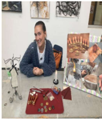
图6 学生的成就, Capstone Fair 的众多展品之一。