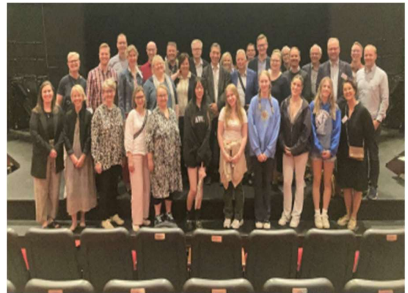
图2 任务完成，芬兰代表团在成功访问Byng和Q合影留念！