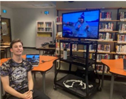
图4 前往北方制作视频后