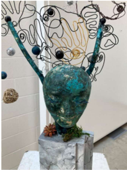
图 7 画廊展出的一件参加今年艺术大赛的装置作品。