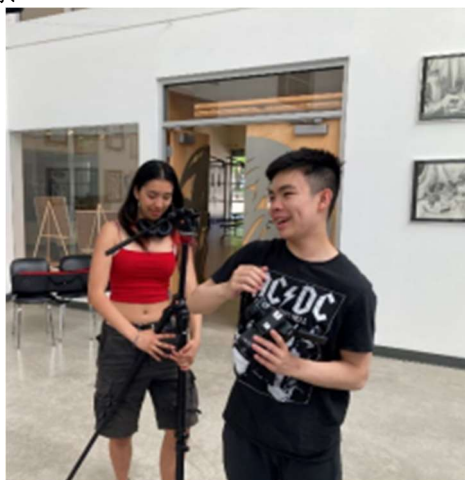
图 4 Action!!豪先生班上的一个媒体艺术电影团队在艺术画廊拍摄了一个场景。

随着学期的结束，所有学习领域的学生和教职员工都在准备完成他们的期末项目。一群勇敢的年轻电影人在艺术画廊完成他们的制作，用画廊里的道具作为效果背景!!