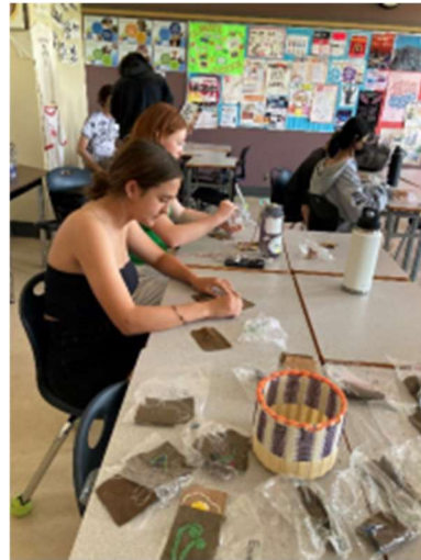
图 11 社会正义 12 年级的学生在为庆祝加拿大国家土著日制作珠饰。