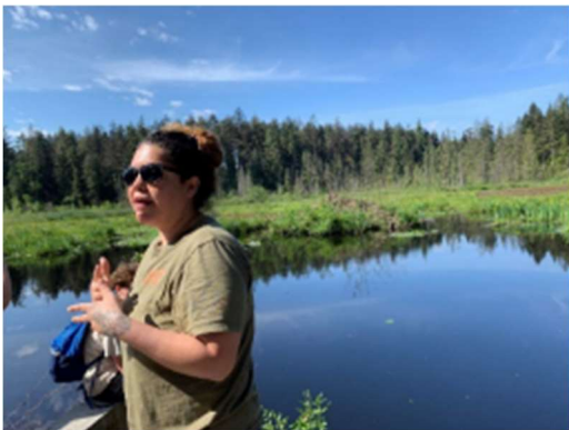
图 13 土著知识守护者提供关于动植物生活和这段历史的课程 海狸湖旁边的土地

图 12 在斯坦利公园的森林里, 九年级的英语学生听着土著长老和知识守护者的教学, 学习这片土地接触相关的历史。