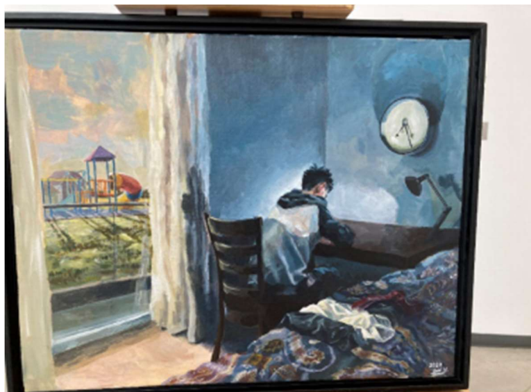
图 5 提交给艺术比赛的作品之一。