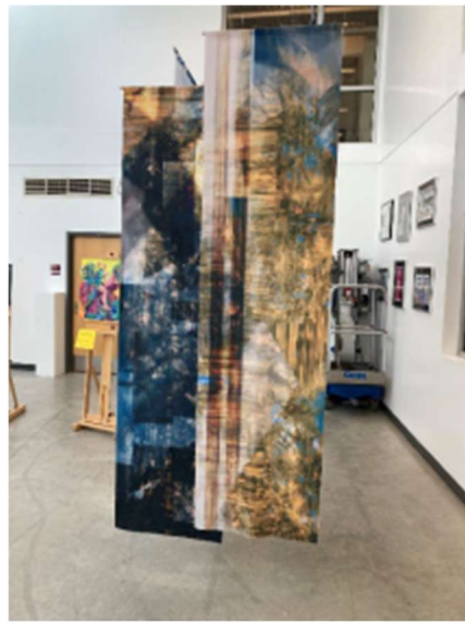
图 6 为今年的艺术比赛提交的画布之一。