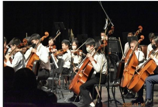
图片 5: LB弦乐乐团在新开放的学校礼堂演出。