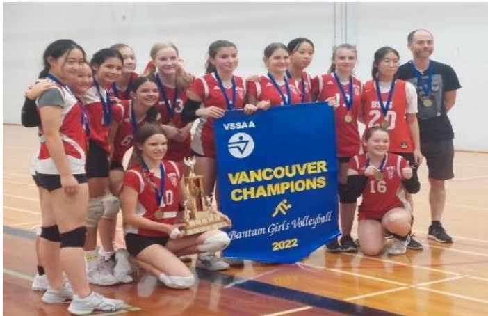
图片1 2022 城市冠军!!!