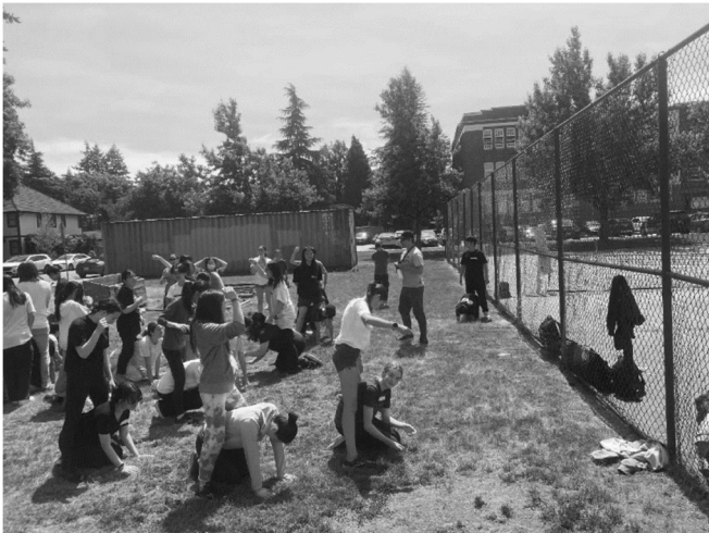
图 5 博尔丁先生带领其中一组参加了一场充满乐趣的运动会活动。