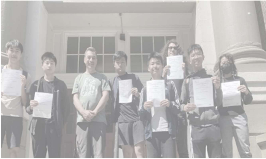
图 4 地球爱好者俱乐部的成员因在环境服务和管理方面又取得了成功而获得认可。