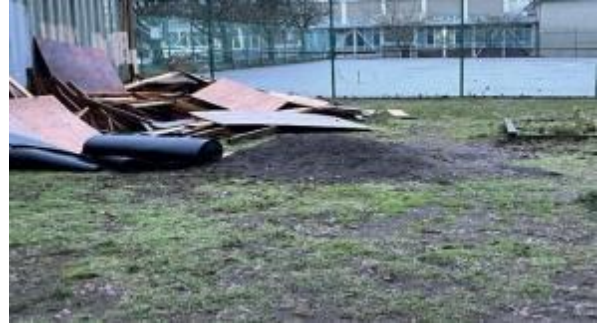
Figure 4 The Garden site before the project started and below since the limestone pad has now been installed.