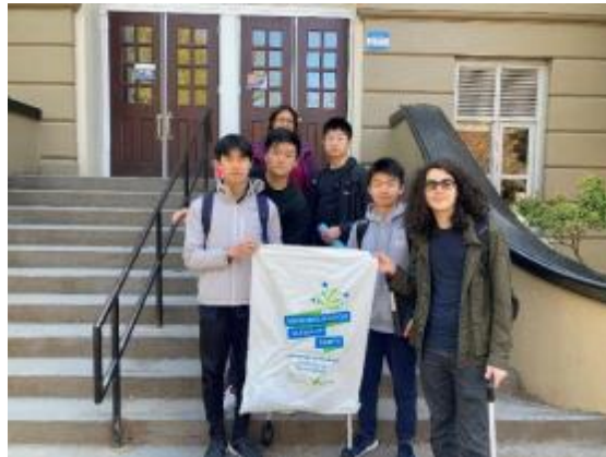
图2 地球热爱者俱乐部成员与JQ的副校长会面，启动校园环境清理工作，并在校内开展环保宣传活动。