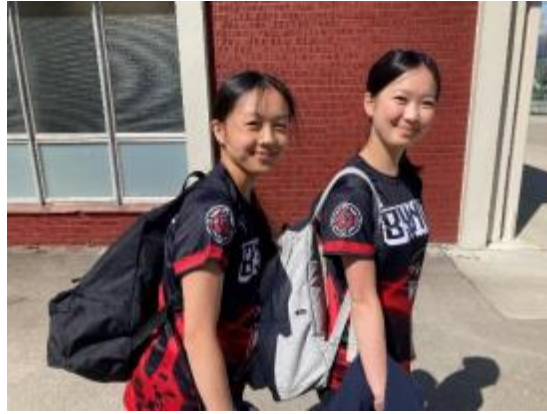
图1 Ultimate team 队员们穿着最新的运动服走向阳光，这是对Musqueam土地的致敬!!!