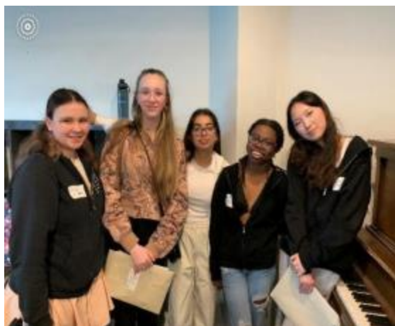
图4 Byng 学生代表在最近的 DEI 会议上：自我与社区关爱与疗愈