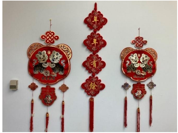
图五 校长办公室里的春节装饰品