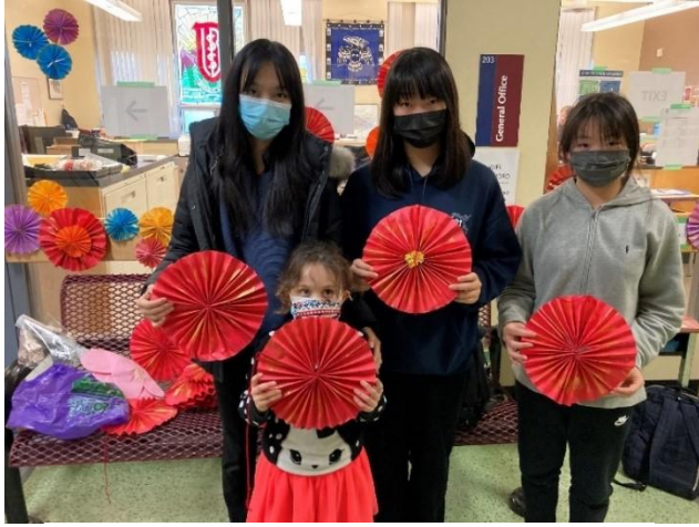
图四 3-B 俱乐部的志愿者和小帮手在展示他们手工制作的装饰品