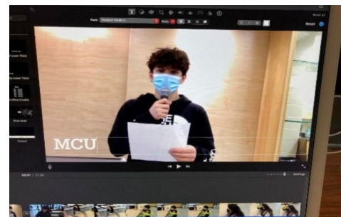
图三 短片中的一个镜头