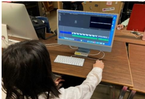
图二 学生们使用图像处理软件编辑他们的期末作品