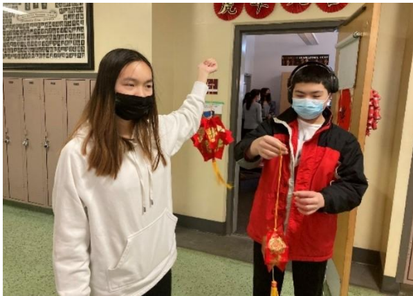
图六 美术班的学生展示他们制作的灯笼