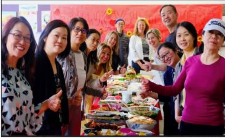
图1。罗宾家长们为2023年员工答谢午餐呈现了令人难忘的盛宴。

本周特别感谢所有了不起的家长们，感谢你们在周三举办的员工答谢午餐上所表现出慷慨及厚爱。感谢所有的志愿者以及出色的厨师们，非常感谢你们以及你们送来的美丽的礼物，我们无比感激。你们的支持及认可让我们都感到非常受重视。