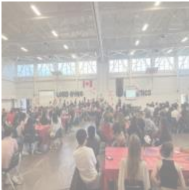
运动员、教练、赞助商和社区成员参加星期二晚上在主体育馆举办的年度体育宴会。

还要感谢我们的每一位教练、赞助商、经理和志愿者，你们的工作非常有价值，为我们学校的学习社区做出了令人难以置信贡献！