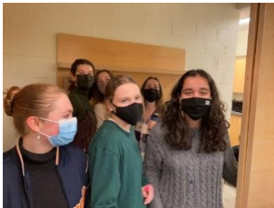
图二：巴拉卡之友在周三的珠宝拍卖会上