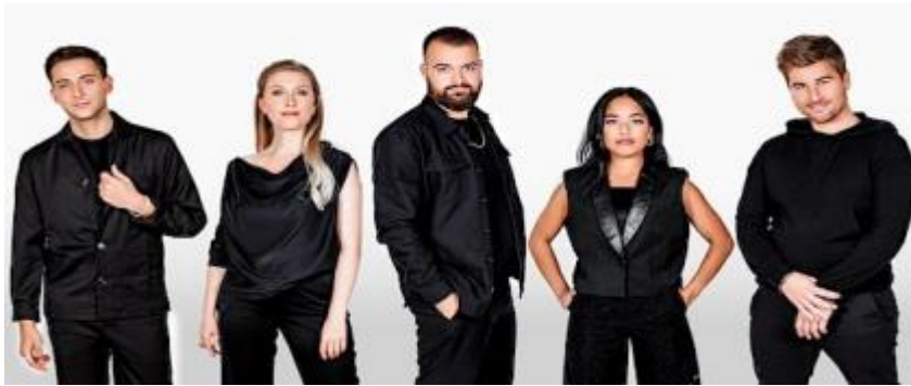
世界级的声乐团体从瑞典返回温哥华！

3月3日星期五，罗宾室内合唱团自豪地开始了他们的演出在枫树街6360号的Magee剧院下午7点