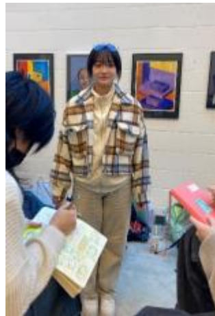
图5学生会年级代表在学校艺术画廊门厅举办一年一度的比赛制作活动。