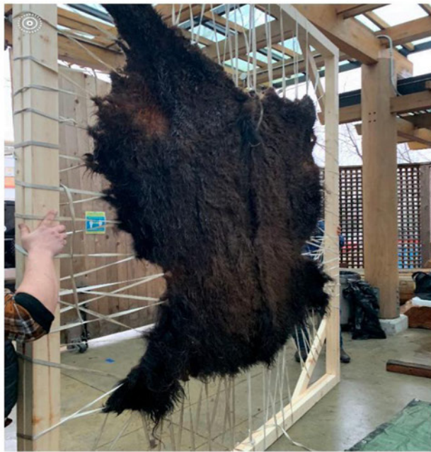
图 3: 在干燥处烘干生皮