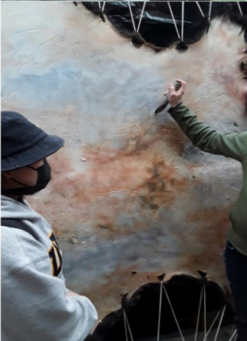
图 4: 学生们看着野牛皮在一个称为“去肉”的过程中准备好。