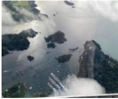
图1 Byng纪录片小组沿着发现的崎岖海岸线向北走去，途中采访不列颠哥伦比亚省北部地区的酋长、长者和社区成员。

周三清晨，Byng纪录片小组从YVR起飞，开始了对北方原住民社区发现、理解和建立连结的不可思议的旅程。