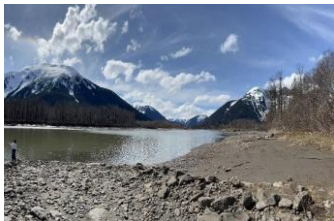
图4 Byng副校长Darlene Hughes女士在一个美丽的春日向斯基纳河抛出了一条鱼线