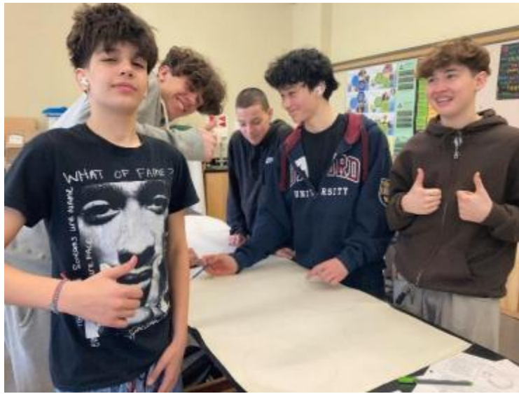
图10 动手学习，Koscal先生的10年级科学班的学生学习了生命的组成部分：DNA、在培养他们作为团队一员学习的核心能力时，Miosis 和 Mitosis!