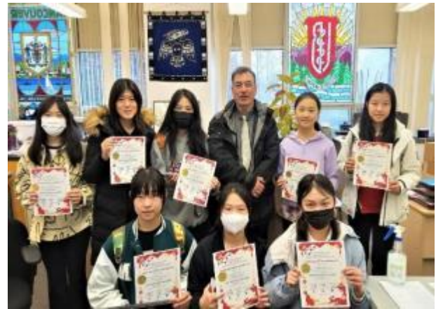
图 16 农历新年歌手在一月份的农历新年庆祝活动中的贡献得到认可!!!