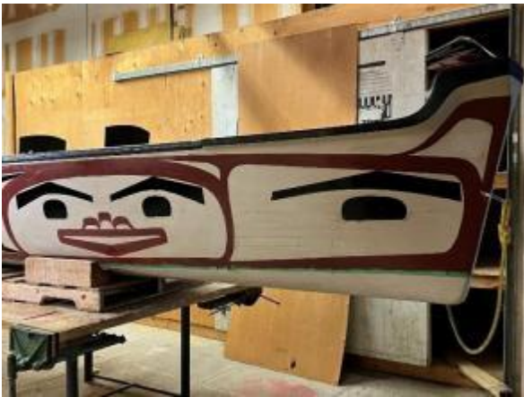
图2 仅仅是小组访问的一所高中的木工车间里正在形成的鼓舞人心的木工项目之一!

"通过故事学习"的旅程还包括学习协议和仪式。当我们访问这些领土时我们将带着礼物来承认他们的主权并表示我们的尊重。其中一些礼物将代表宾。希望其中一些礼物是我们的专业知识和技能，我们可以与Lax Kw'alaams的老师和学生分享。我们每个人都将寻求与Lax Kw'alaams建立联系和社区的方法：通过视频制作和编辑技能；通过终极/PE游戏和体育/户外教育；通过学习我们有哪些技能可以让社区利用。