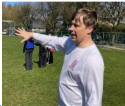
图6 前加拿大极限飞盘队队员博尔丁先生在罗宾运动场上指导学生比赛来啦。

由于您的热情和领导力，我们学校的学生每天都能得到呈现和准备好的丰富学习机会。这些机会与地区教育计划2026年的目标相符合，